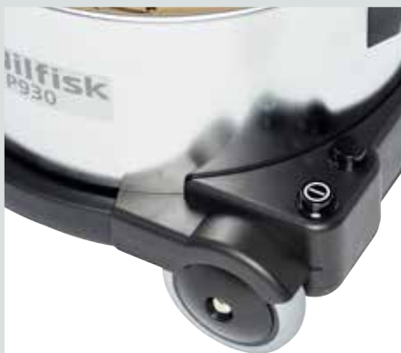
Utvalda modeller har dubbla hastigheter