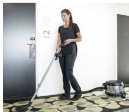
VP930 är specialkonstruerad för bullerkänsliga miljöer med lågt bakgrunds ljud, med en ljudnivå på bara 53 dB(A)