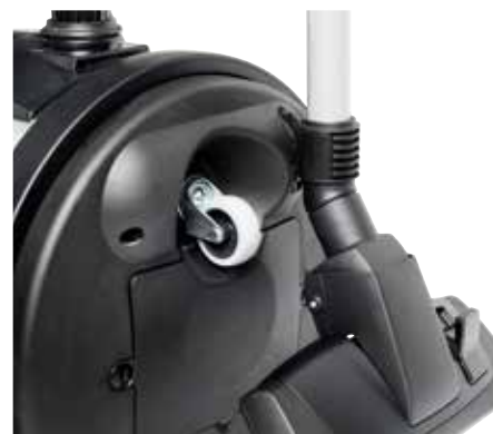
Parkeringslösning som standard