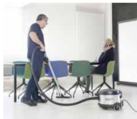
VP930 är det perfekta valet för krävande rengöring av t.ex. kontor, hotell och offentliga byggnader