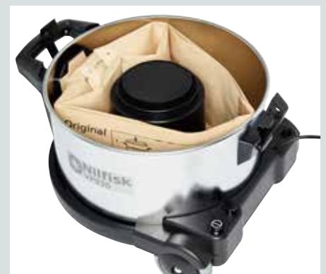
Hållbar stålbehållare och dammsugarpåse på 15 liter