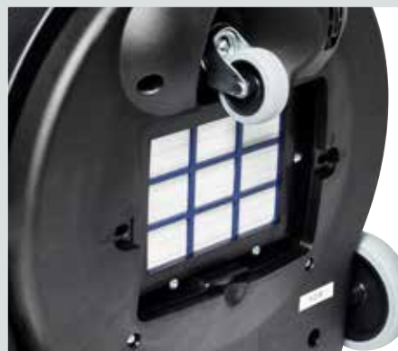
HEPA H13-utblåsfiler för toppklassad filtrering samtidigt som man bibehåller en hög luftkvalitet i området som rengörs